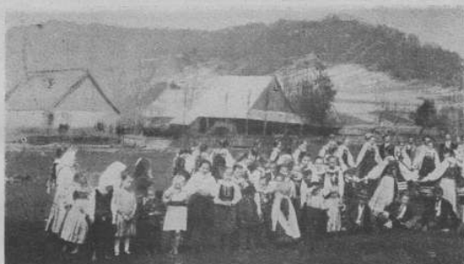
Гейліки у Висовій.

Але марна надія москвофітів, що захоплять Народний Дім, бо він