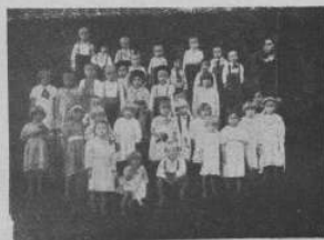
Дитячий садок у Морохові.

Дорогим мойому серцю Чесним Громадянам, Громадянкам та шкільній дівчорі в Матієвій, Складцім, Ростічках, Чачові, Барнінци, Злошчїм, Щавнічку та Ястрабіку, бувашим моїм парохіянкам як рівнож співачким хорам в Лосім і Новій Веси та диригентові п. Кобанієві і п. Савчаківі, в Новосандеччині, з нагоди Празника Пасхи та другої річницї незабутого нашого пращанія передаю найцирїці мої бажання: Хай Воскреслий Ісус, що Його Найсвятїше Тїло і Кров недавно приніяв