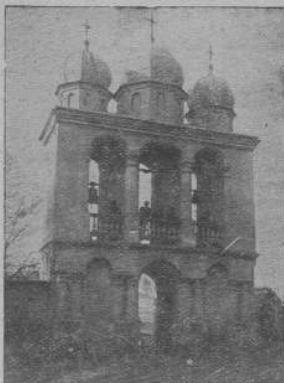
Святогорівська дачища в Юрівцях — Сяніччина.

Багато лемків, будучи підчас війни на ріжних фронтах та в ріжних краях, голуюво в Америці, прозрили та пізнали, куди їх вели русскі проводирі з Сянока. Вони зрозуміли, що те може бути москалів за Сяном, коли їх немає до Сяму, пізнали, які їх батьки та чії вони діти, переконалися, що вже годі довше оставати в темноті, якщо не мають марно провадяти та стати погномо других — Осували кооперативн, читальні «Просвіти», Кружки «Рідної Школиці», почали мазово читати рідні часосипи, книжки, давати театральні вистави. Подачили це «русскі», що нема ім уже місця по селах, бо люлям відкрислися очі, а вони, їхні доведені проводирі остали зайвини, остали пастирями без стада. І давий цаново здобувати бодай колішні їхні твердині як: Костарівці, Чертеж, Юрівці, Вільхівці, Сянічок, Межибріді й інші. Найбільше завзялися на Костарівці. Підлукали в селі ще кількох твердолобих та тяжко думаючих недобітків, русских, жадних користей і зачали їх посилати до поліції, то до старостава... І посилалися доноси, наклепи, брехні на невинних людей, тяганна та арешти, а вершком всього було роззавання Кружка «Рідної Школиці», неправне загарбання добре просперуючої кооперативн «Надія», яка має навіть свій мурований дім. — Тепер у селі «русский кооператив», до якої мало хто ходить та мало хто купує, рівнож і читальня Качковського пустою світвіт — бо ніхто не приходить, а в селі відбуваються забави та танці тнх, що винймають собі, гроші відуть до кишені управн. — Люди від-