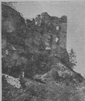
Руїни старинного замку в Морохіві. Про події, що відбувалися в давнині у цьому місцеві, буде в дальших числах.

ще село Ратковця , на північній захід від Морохова, як це бачимо зі скаргі, яку 19. вересня 1449. р. Гнат з Гузельова вніс до сянцького городського суду проти Степана з Ратнавиці. В 1468. р. переведено розмеження між послистими Небещанами, Велополем та Велопольською Водею з одного боку і Морохом та Морохівською Волею , теперішню морохівською Завалою, з другого — між Морохом і Поражем та Чашином і вписано в сянцький судові книги.