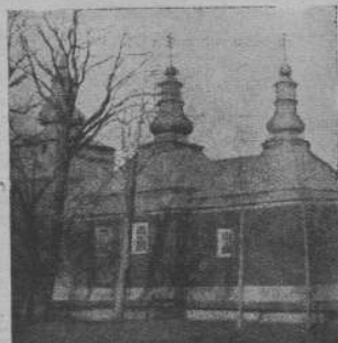
Деревяна церква в селі Перегримка, біля Жмигорода, зб. 1870 р.

Хоч село має славу мнушувини, однак тепер (на жалі!) має сумну дійсність. Ще в 1926 році один господар, по повероті з Америки завоїв тут сектанство, яке страшно розідає село. І хоч теперішній парох про-