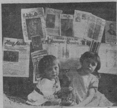
Виставка української преси в Лосю