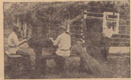
Виплітання полукішків у селі Королів. Вороблик.

Видавництво „Батьківщина“ Львів, Чарнецького 8.