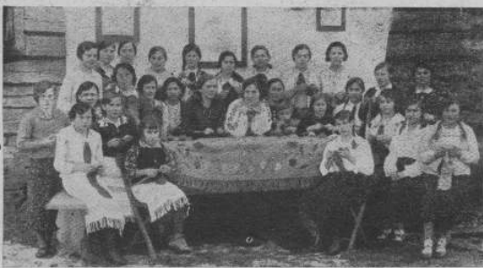
Учасниці Трикотарського Курсу

на яку складаючи щомісячно вкладає від 5 за. в тору, можна до році одержати крім звичайних відсотків ще й премію за ошадністі 25 до 100 за., залежно від висоти постійної місячної вкладки