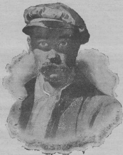
Тарас Шевченко у салдатах, у 1848 р.

... А як умирав, то казав себе поховати „серед степу широкого на Україні милай” та на могилі високої, бо звідтіля начеб хотів бачити, як пробуджена його віщим, вогненным словом Україна „врати буде кайдани”, як „змиватиме вражою, злою кровю свою волю” та як Дніпро ревучий „нестиме що ворожу кров ген аж у сине море”... Здійснення всього того, чим горів і яснів його творчий дух, чим він сам жив, за що борювся і терпів, — вимагав Шевченко у своїх звичанні від земляків, бо йнакше, то його дух навіть і на тім світі не