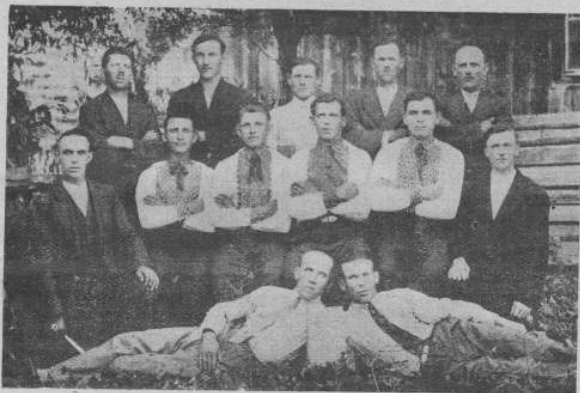
Виділ Читальни «Прогвіти» в Тиряї Волоській.