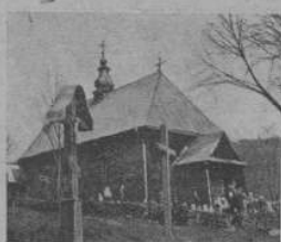
Українська греко-кат. церква у Віршматі.