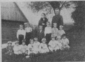
Дитячий садок у Сянiчкy

тривав від 1/7 до 15/8 1937, приміщений був в домівці громадського дому. Дітей ходило пересічно 20—22, а вписаних було 25. До садка приходили часом діти місцевих „русских“. Діти приносили зі собою друге снідання й підвечірок (переважно хліб і молоко), а крім цього доставали два рази в тиждні на снідання по булці. Дитячий попис відбувся в дні 15/8 1937. Це було „Свято матері“ — полчене із закінченням садка. У програмі відішло 28 точок. Крім цього в дні 8/8 1937 уладжено для родичів садка, чайний вечір, який причинився до по-