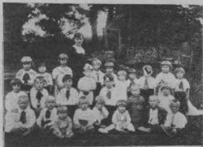
Дитячий садок у Добрій Шляхоцькій

У цей спосіб пропали садки, на які Кружок звертав найбільшу увагу, а саме на терені березівського повіту в селах: Улюч, Володж, Іздебкі, Глудно, Вара, Поруби, Селиська, Лубне та Гута; на області ряшівського повіту: у Бонаріцях. Подання на всі садки, за винятком Бонарічки вносив Кружок „Р. Ш.“ у Сяноці як Повітовий та він робив усі заходи, щоб удержати дозвіл.