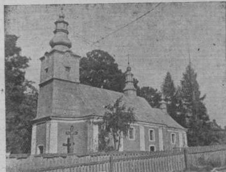
Українська греко-катол. церква в Малоставиві.