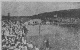
Тисячі учасників у Святі в Журавині.

Народні школи є тепер у всіх тих трьох оселях. Освітнє життя у тих трьох оселях починає прозябати десь около 1903 р. Саме тоді в Королеві Руській основано читальне Качковського, до якої вписалося 15 членів. За десять літ існування прибуло до неї двоох членів. Тут не згадується про такий членський рух тому, щоб з нього помятисся; ні, бо такий членський рух, в порівнанні з дозрілим до тієї справи, числом меш-